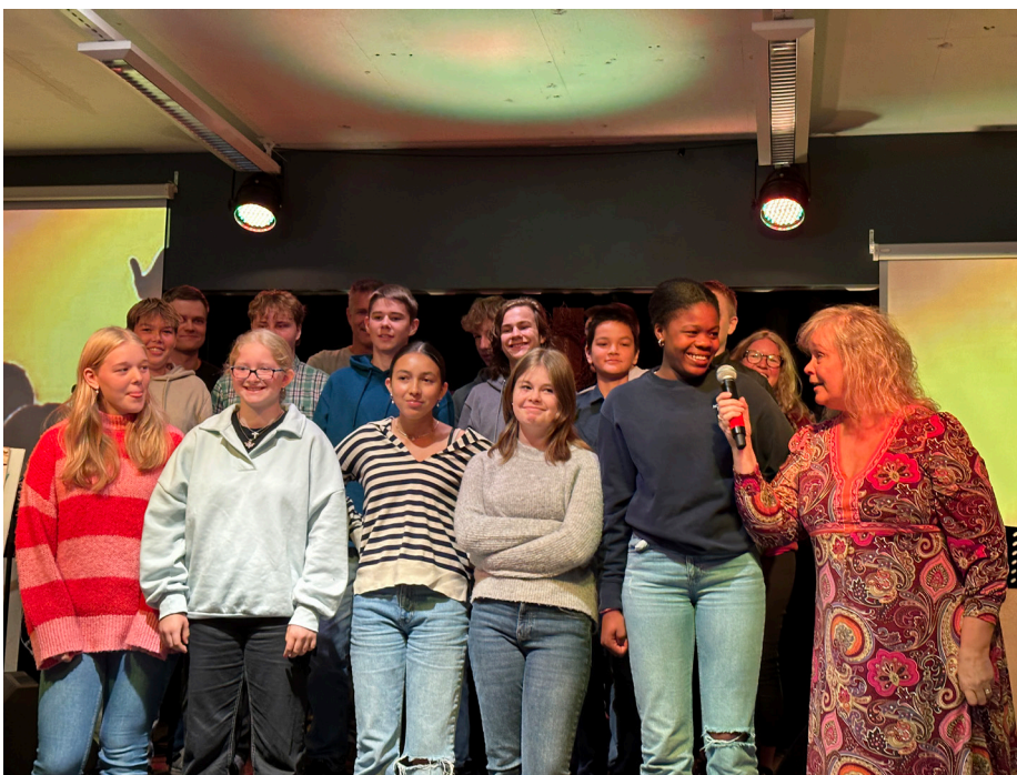
Tentro 2023 - en super gjeng.

Denne vinterens Tentro kull fikk sin start første helga i september på Flø Feriesenter. Denne «bli-kjent» helga ble en god start for denne flotte gjengen med overnatting, bibelstudier og aktivitet både ute og inne.