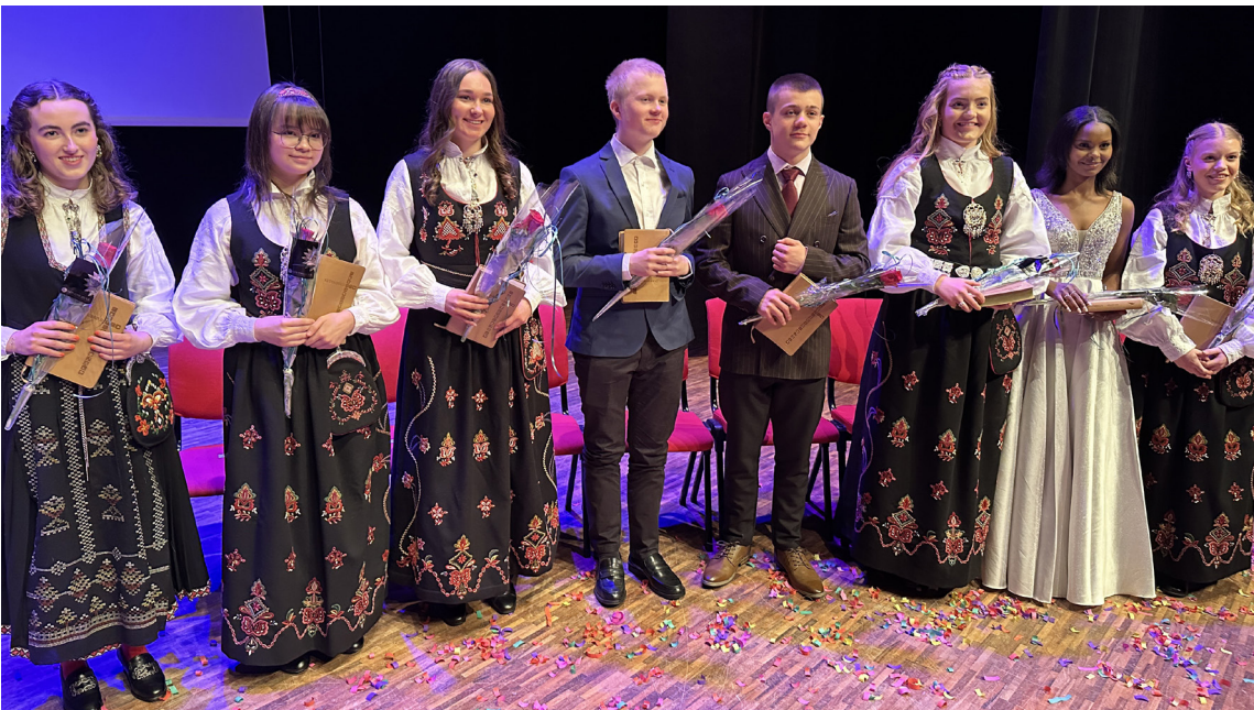
Tentro kullet 2022-2023.

Også denne våren fikk vi være med å feire avslutning av et år med Tentro undervisning. Tradisjonen tro ble avslutningsfesten avholdt på Sjøborg og mange fant vegen dit, slekt og venner.