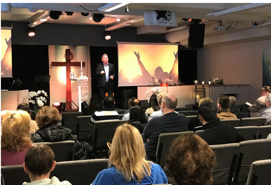
Trivelig søndag på Filadelfia.

I slutten av februar var pastoren i Ulsteinvik Bibelsenter invitert til nabo menigheten Filadelfia Ulsteinvik. Dette ble en trivelig søndag i sammen, der disse to menighetene kunne ha søndagsmøte i sammen. En ikke helt vanlig konstellasjon, men vi kjenner at det er godt å være sammen fra tid til annen.