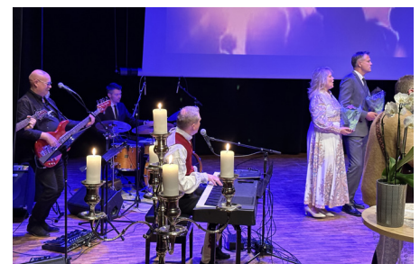
Lovsangsbandet i Filadelfia Ulsteinvik.