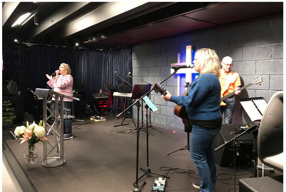
Lovsang bandet i aksjon.

Denne høsten har vi startet opp rene lovsangkvelder i menigheten. Dette er jo ikke noe nytt, det er mange som har dette i sine sammenhenger og det er en viktig del av et menighetsliv. Alle har det gjerne på sin måte og enhver menighet vil nok legge sitt preg på slike samlinger.