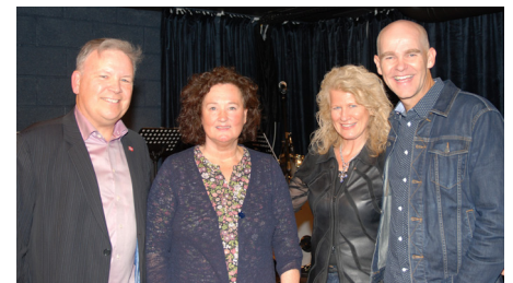
En fornøyd gjeng etter en fantastisk helg.

vel verdt å høre. Budskapet er utfordrende og etterlater seg en klarhet om at dette må hver enkelt ta opp til vurdering i sitt eget liv – hvor står jeg og hvilke reelle grep må jeg gjøre i mitt liv for å komme på sporet av et normalt kristent liv.