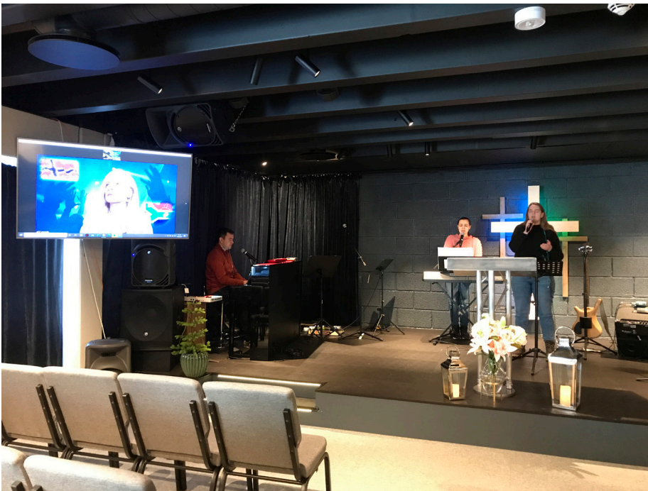
Zoom møte fungerte både for folk i salen og hjemme.