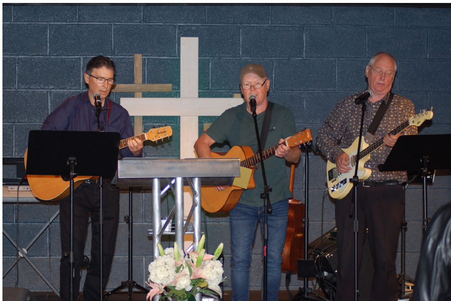
Praise i aksjon.