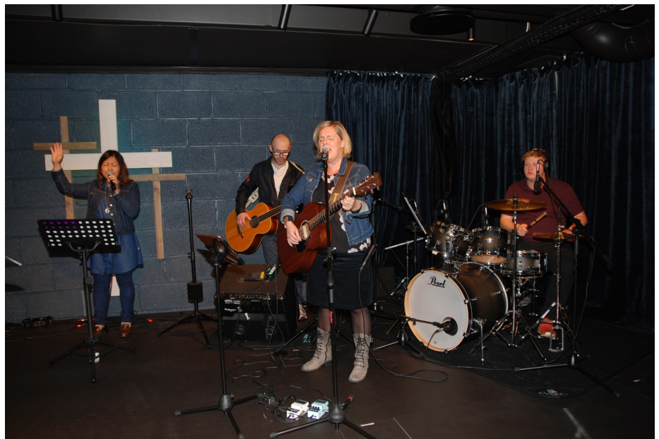
Lovsang på torsdag.

For de som går på møtene våre, så vet de at det er greit å komme på lovsangs øvingene våre på torsdagene og være med der som deltager i salen. På disse torsdagene kjører vi selvsagt med fokus på øving, men enkelte torsdager har vi begynt å åpne opp for rene lovsangkvelder. Dette har blitt en fin anledning for folk å komme og bli med og vi har fått mange positive tilbakemeldinger.