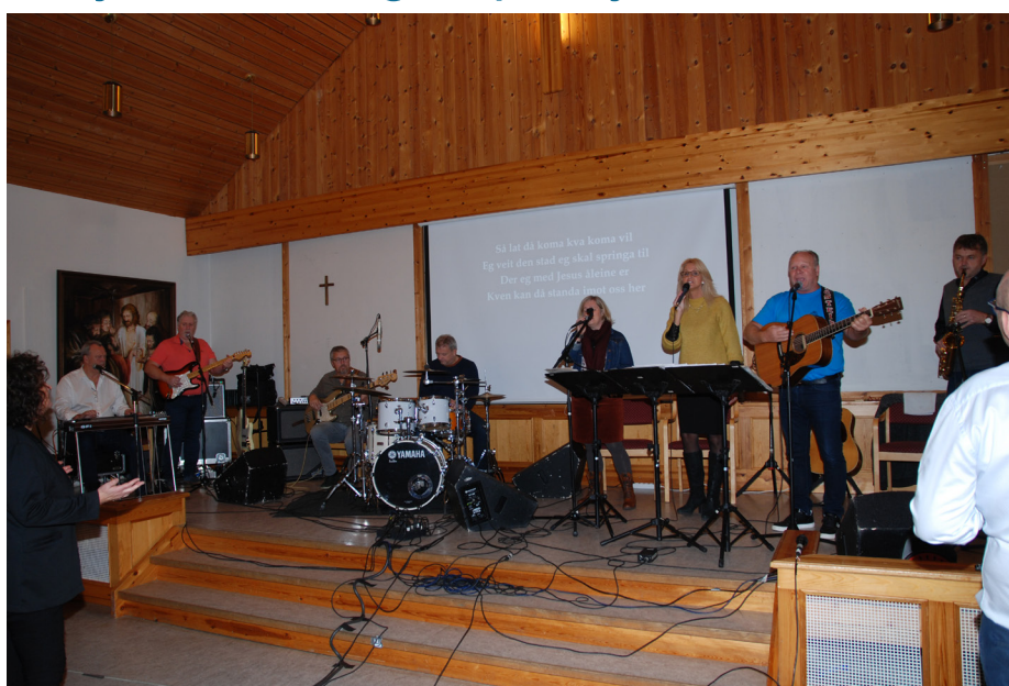
Musikken til Misjonsbefalingen på Kjeldsund.