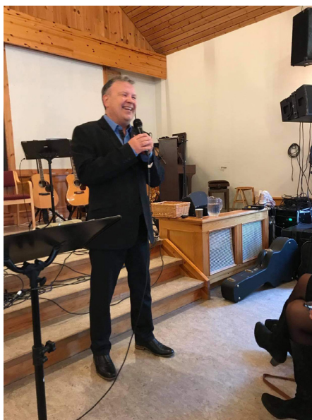
Søndag var det pastorens tur å tale.

I naturskjønne Kjeldsund var det i siste helga i oktober møteserie med Misjonsbefalingen. Flere lokale krefter var med her og på søndagsmøtet var det Ulsteinvik Bibelsenter som var i aksjon.