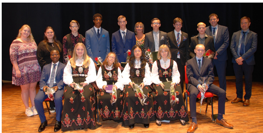
Tentro elever og lærere 2020.