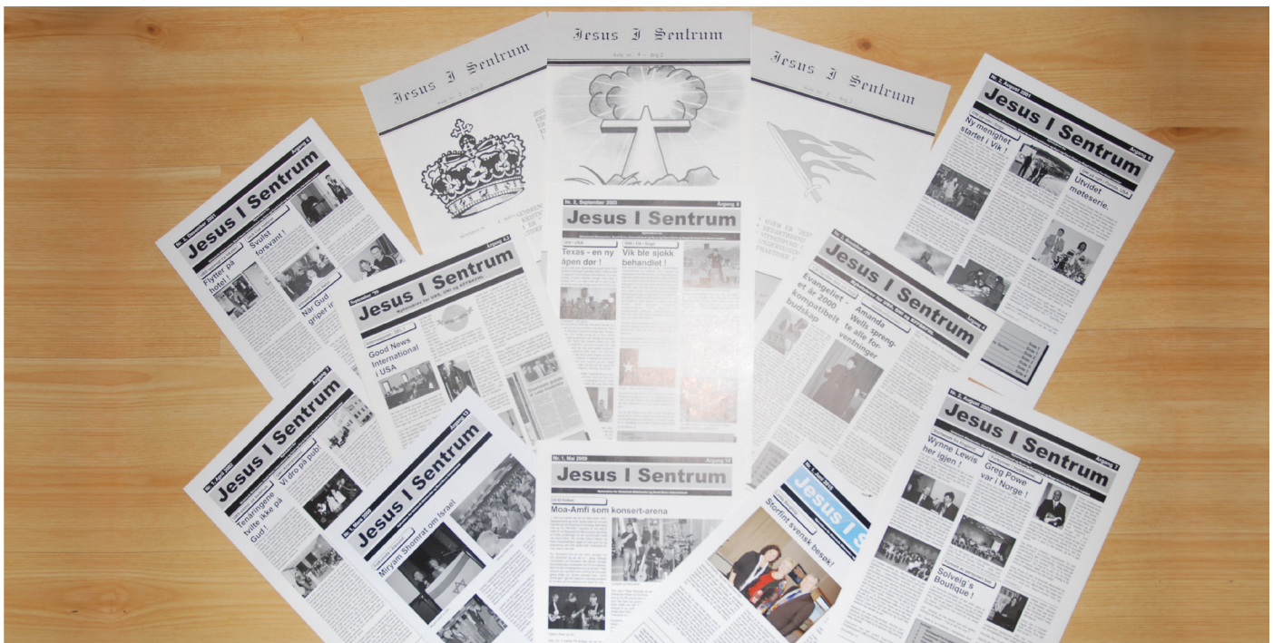
Noen Jesus I Sentrum utgaver av tidligere årganger.

Bladet, eller nyhetsbrevet om du vil, som du nå holder i hånden, har 25 års jubileum i år. Dette nevnte vi så vidt i forrige nummer, men i dette nummeret må vi skrive litt rundt det.