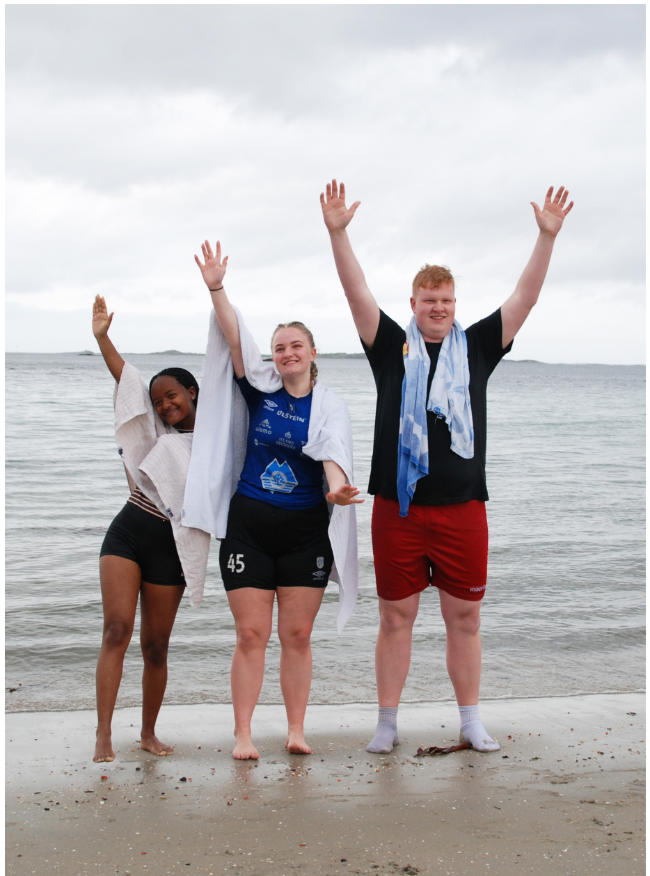
3 glade ungdommer.

det vanskelig å ha en god samvittighet overfor Gud dersom man vil vandre med Ham og ikke gjøre det Han sier i sitt Ord, det handler om lydighet.