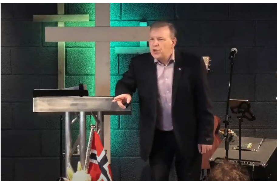
Direktesending på Youtube.

Vær ved godt mot venner og følg med på vår Youtube kanal!