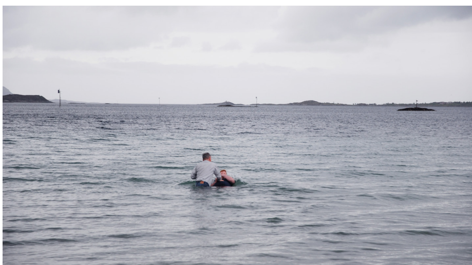
Begravet med Kristus.