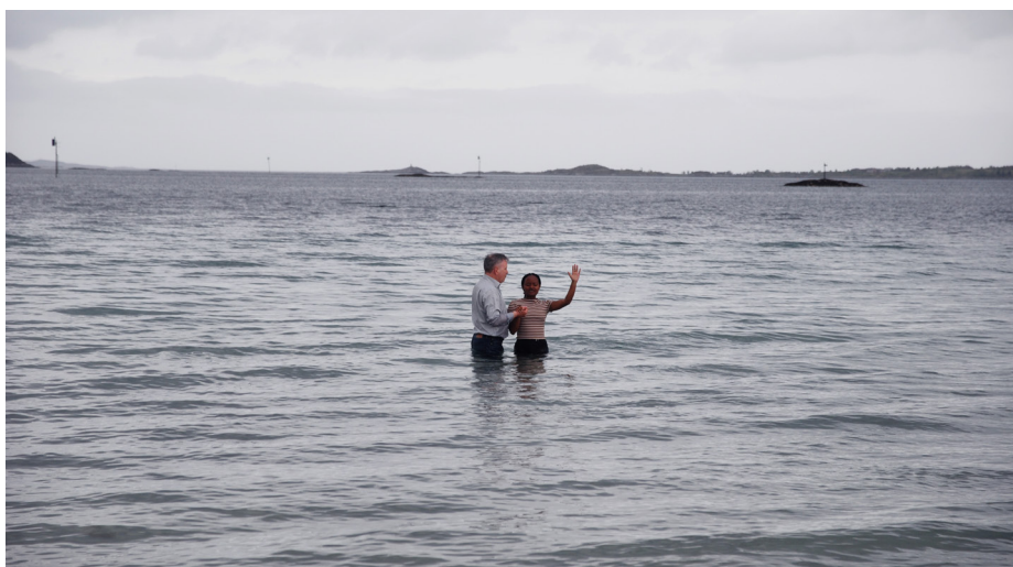
Oppstått med Kristus.

Det er alltid herlig når unge mennesker vil følge Jesus på alvor og ta valg som er i tråd med Guds Ord. I mai døpte vi tre ungdommer. Det å døpe seg med bibelsk dåp gjenspeiler alltid en egen vurdert handling, der man tar et bevisst valg innfor Gud. I følge bibelen er der ingenting som heter hverken barnedåp eller voksen dåp. Det tales alltid om troendes dåp. Dette er viktig å ha klart for seg, at skal man døpes, må man ha et bevisst forhold til Herren Jesus Kristus. Da kommer det ikke an på alder, det kommer