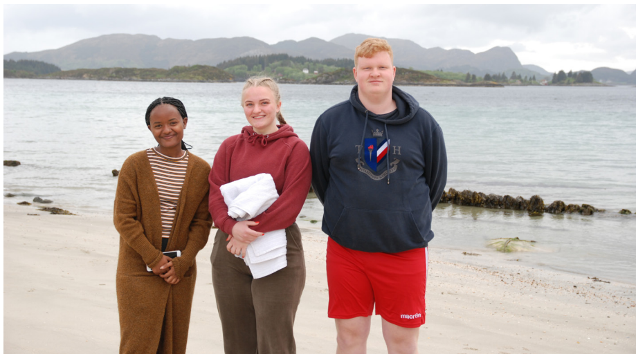
3 klare ungdommer.