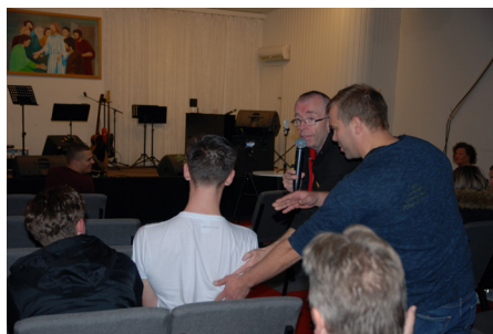
Flere fikk erfare Guds Kraft.

Men det sterkeste er jo selvsagt når mennesker blir frelst. Der var flere som tilkjennegav at de ville bli frelst og kunne vitne om en forandring på innsiden. Forbønn for syke ble det også mye av. En ble helbredet i kneet, en annen fikk tilbake ene knoken på hånden. Denne knoken hadde han mistet i slåsskamp, men denne kvelden kom den tilbake på plass igjen.