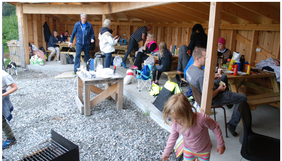
Jonsok og grilling hører sammen.

Jonsok aften er kvelden da man feirer Johannes døperen etter det vi har hørt. Om dette er korrekt, så kan man i alle fall som menighet feire denne midt sommer kvelden. I år samlet vi menigheten på Kjeldsund der det var grilling, bading og vafler i god stil. Et hyggelig sosialt samvær var dette og menigheten hadde også tilgang på vannski kjøring og tube bak hurtiggående båt. Dette var det bare barna som benyt-