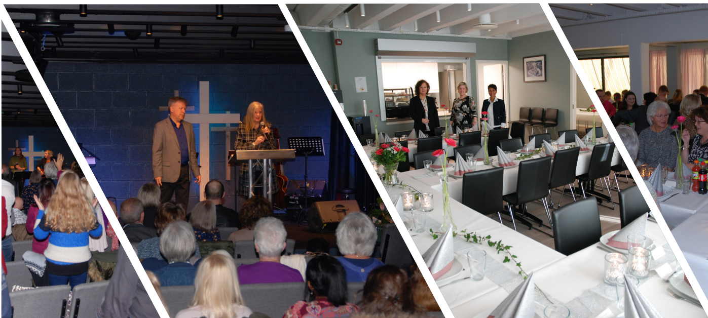
30 års jubileet falt sammen med innvielse av eget bygg.

Første helga i november var det endelig klart for stort jubileum for Ulsteinvik Bibelsenter. Da kunne vi invitere til storhelg med feiring av både 30 års jubileum og innvielse av nytt eget bygg for første gang. At dette skulle klaffe så overens er vel mer enn vi hadde håpet på for et par år siden. Det har vært en lang vandring for menigheten å ikke kunne eie eget bygg i løpet av disse årene. Men som en av våre trofaste medlemmer kommenterte, så «slo vi Moses og Israelittene med 10 år».