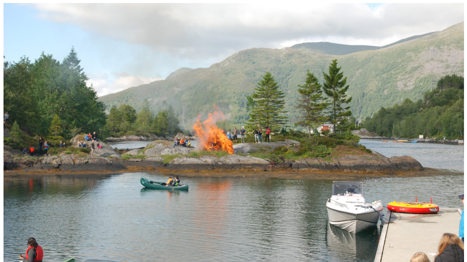
Jonsokbål på Kjeldsund.