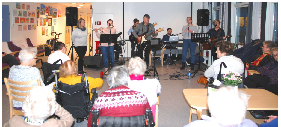
Et lydhørt publikum.

I begynnelsen av februar hadde lovsangs bandet i Ulsteinvik Bibelsenter konsert på Øya på Larsnes. Øya er samlingstedet for Sandetun og Haugetun der beboerne har sine arrangement. Hele bandet var på plass og var spente på hvordan dette ville gå. Det er ikke daglig kost å spille for en forsamling der snittalderen ligger noe høyere enn de man til daglig omgås. Men her fikk bandet en hjertelig og varm velkomst. Det kan jo bli litt voldsomt når det kommer 8 musikere og sangere med slagverk og instrumenter. Men denne spreke forsamlingen på gamlehjemmet syntes dette stod av seg. En av pleierne spurte en av de framtmøtte om det var for høyt lydnivå. Da fikk hun til svar: «Nei, er det noen som sier det da»? Det viste seg at trommer var det beste vi kunne tatt med oss. De sang med på de gode gamle vekkelses sangene som de kjente igjen fra sine yngre år, og da var det supert at vi hadde slagverk fikk vi vite.