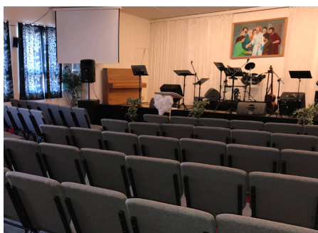
Til å stole på.

Endelig har vi fått nye stoler i våre lokaler! Det har lenge vært et ønske om å få litt bedre stoler å sitte på når vi er samlet til møte. Midt i april måned kom de og dugnadsånden tok fort overhånd. Vi troppet opp fem ivrige sjeler og gikk løs på utpakkingen. Litt prøve sitting og opprasting måtte til, men til slutt så vi at dette ble bedre enn vi hadde forestilt oss. En annen ting vi fort oppdaget var at lydmessig ble rommet helt annerledes i og med dette er tøy trukne stoler som demper bedre. Dette vil nok lyd folkene sette pris på.