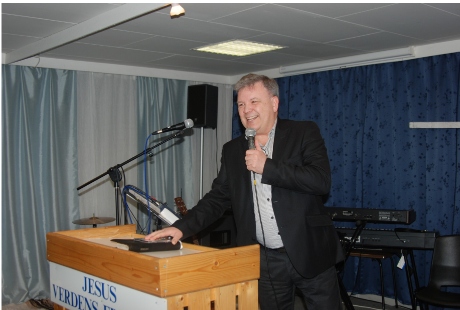
GNI har de gode nyhetene.