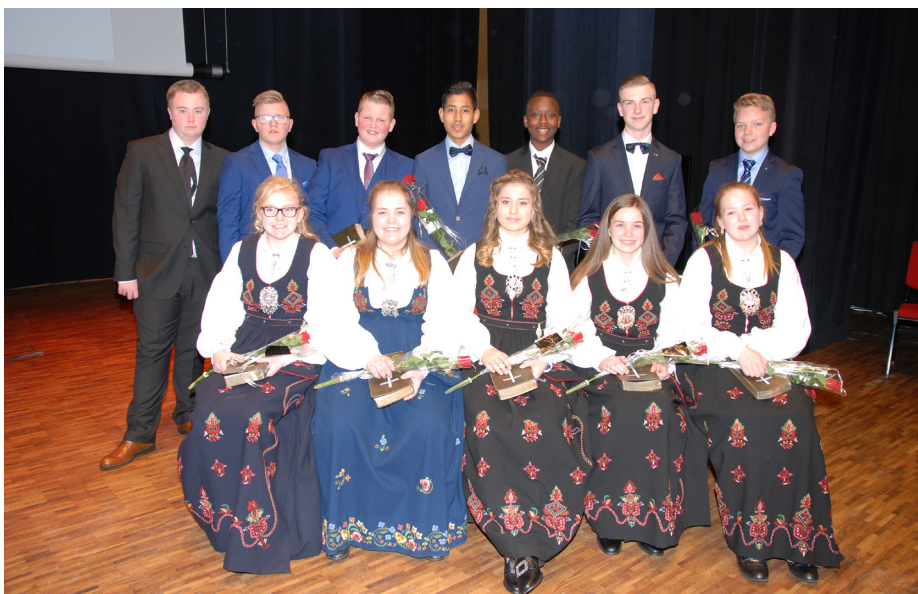
Tentro kull 2017.

Siste helga i april var det igjen duket for Tentro avslutning på Sjøborg. Dette høytidelige arrangementet har etterhvert blitt en årlig foreteelse. De tre menighetene Filadelfia Ulsteinvik, Sion Gurskøy og Ulsteinvik Bibelsenter har tydeligvis funnet et samlingspunkt som får masse positiv tilbakemelding og som vokser fra år til år.