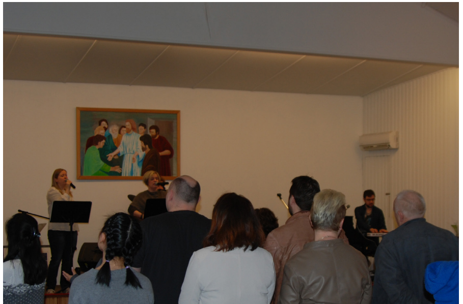
Lovsangsteamet i action.

- Ja, det vil eg sei. Ein av ungane spurte meg når dei var små: "Mamma, kvifor syng du