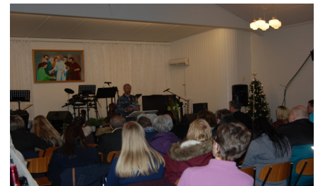
Mange hørte hans vitnesbyrd.

Videre talte han om hvordan komme inn i og leve i det umulige. Han tok utgangspunkt i Elia på Karmels fjell der han utfordret baal profetene. Egentlig en umulig situasjon, men han visste Hvem han hadde med seg. Derfor ble det seier i en umulig situasjon. Dette er en av de hen-