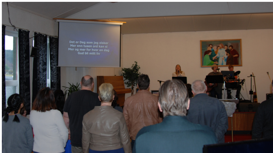
Mye folk fra første stund.

Palmesøndag kunne vi ønske velkommen i nytt lokale. Som kjent måtte vi ut av Aktivitetshuset da dette ble solgt til nye eiere. Men Gud svikter aldri sitt folk likevel og vi fikk oss