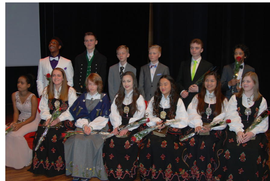
13 glade Tentro avgangselever.

3 menigheter står sammen. Familier fra 3 menigheter samles til fest. Venner til ungdommer fra 3 menigheter kommer sammen. Sjøborg er fylt opp med spente og feststemte mennesker som vil være med når årets kull av Tentro elever har avslutning og markering ved fullført Tentro – et alternativ til kirkens konfirmasjon.