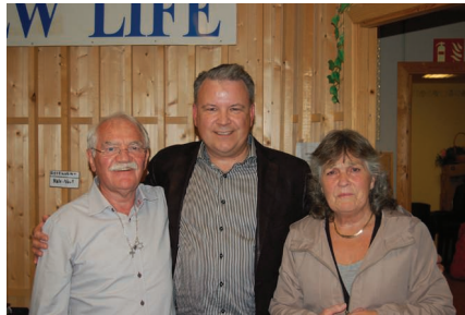
Hyggelig med gamle venner.