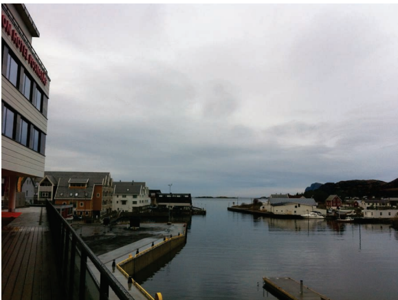
Innløp Fosnavåg havn.

I begynnelsen av september var to av Ulsteinvik Bibelsenter sine medlemmer i Fosnavåg på gateevangelisering på dagtid. Dette ble en festreise vi bare kan fryde oss over. Først fikk de be for og velsigne en eldre herre som allerede var frelst. Han møtte Gud så sterkt