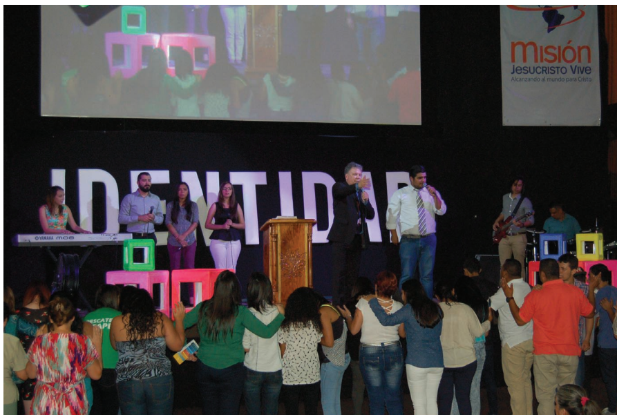
Evangeliet forkynnes med kraft.