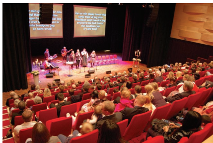
En minnerik dag på Sjøborg.

På denne regntunge siste lørdagen i april ble Sjøborg inntatt av to menigheter - Filadelfia Ulsteinvik og Ulsteinvik Bibelsenter - med familier slekt og venner for å feire Tentro avslutning 2014-15. Det var en glede å få feire denne dagen i sammen med disse flotte 15-åringene som gjennom vinteren har deltatt på det som kalles Tentro, et alternativt opplegg til det vi tradisjonelt kaller konfirmasjon i vårt land. Denne høsten, vinteren og våren har altså de to pinsekarismatiske forsamlingene i Ulsteinvik gjort et samarbeid og ungdommer fra begge menigheter har kunne nyte godt av solid og bibeltro undervisning, samt mye moro og sosialt samvær. Her har de fire lederne - to fra hver forsamling - gjort en enestående innsats, ja faktisk så bra at det