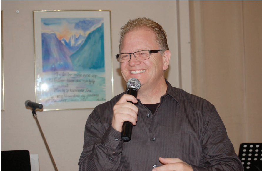
Helbredelsesskolen skuffet ikke.