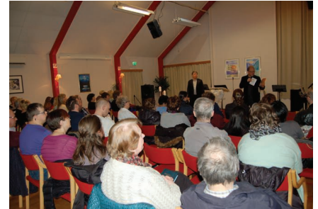
Deltakerene fikk være aktivt med.

Flere syke søkte helbredelse og de gikk ikke skuffet derifra. Ryggplager, nakkesmerte, stivhet og leddplager måtte gi seg. Til og med