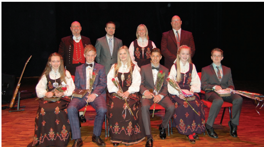
Tentro elevene ilag med lederene.

På denne regntunge siste lørdagen i april ble Sjøborg inntatt av to menigheter - Filadelfia Ulsteinvik og Ulsteinvik Bibelsenter - med familier slekt og venner for å feire Tentro avslutning 2014-15. Det var en glede å få feire denne dagen i sammen med disse flotte 15-åringene som gjennom vinteren har deltatt på det som kalles Tentro, et alternativt opplegg til det vi tradisjonelt kaller konfirmasjon i vårt land. Denne høsten, vinteren og våren har altså de to pinsekarismatiske forsamlingene i Ulsteinvik gjort et samarbeid og ungdommer fra begge menigheter har kunne nyte godt av solid og bibeltro undervisning, samt mye moro og sosialt samvær. Her har de fire lederne - to fra hver forsamling - gjort en enestående innsats, ja faktisk så bra at det