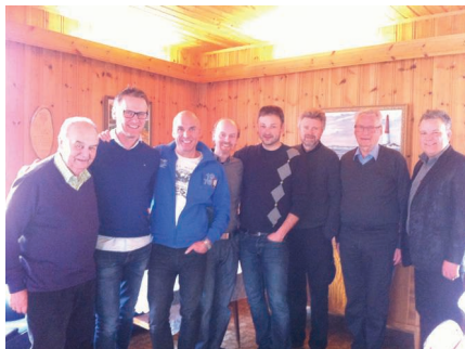
Alle pastor-kameratene samlet.