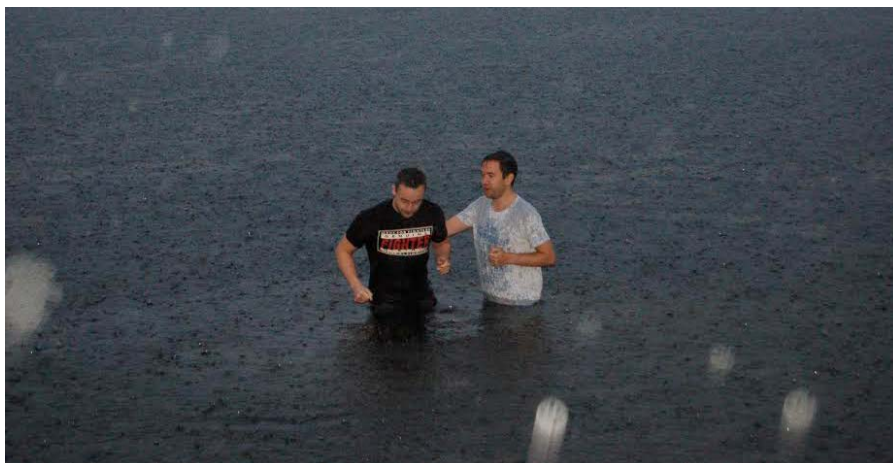
Den unge mannen viser att han tar troen på alvor.

Også denne høsten har vi sett mennesker bli frelst og født på ny. Men ikke bare det, vi har også sett folk gå i dåpens grav og begynt et nytt liv med Kristus. Selv om regnet har pøst ned, så har ikke dette hindret folk i brann for Jesus å la seg døpe ute i Guds frie natur. Det er spesielt herlig å se unge mennesker ta radikale valg for Herren og begynne å følge Ham. Som kjent er der ikke frelse i dåpen,