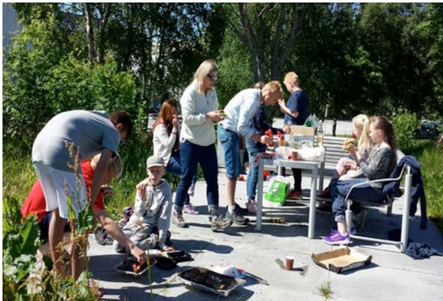
Sol, grilling og Jesus.