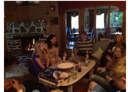
Her er noen høydepunkt fra turen; bading, grilling, felleskap og uteaktiviteter!

Den siste helga i juni satte vi oss i bilene og satte kursen mot Tafjord, og det nyopprettede omsorgssenteret der. Her skulle vi ha noen kjekke dager med menighets-"retreat" og nyte felleskap og ha det gøy sammen. Turen var åpen både for medlemmer og andre som ville bli med. Turen innover gikk fort, og litt for fort for to av bilene, som måtte ta imot forenklet forelegg etter å ha kjørt noen kilometer for fort. Men dette skulle ikke stoppe en kjekk helg!