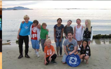
”Snapshots” fra det siste året!

En ukedag i starten av 2011 samlet vi fire av de yngste i menigheten som da var i alderen fra 10-12 år. Vi laget til litt mat og hadde undervisning og samtaler om Jesus. Noen uker etterpå tok vi en samling til. Deretter ble dette en månedlig samling, der samtaler og temaene gikk innom stadig nye ting i Bibelen. Rett før sommeren kom det flere til, venner og kjente av de som allerede var med, og gruppen vokste.