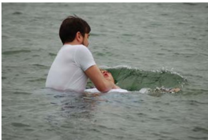
Begravet med Kristus og oppstått med Kristus.

Og at det er flest unge som tar dette skrittet er jo ekstra spennende. Det betyr at disse ungdommene søker Gud istedenfor å følge «normal» tradisjon. Får man ungdommen tent på å følge Jesus på alle områder, er det håpe også for framtiden. Ansvarer ligger likevel på den som har vært med lenger, at man lærer de opp i alt det Jesus sa vi skulle.