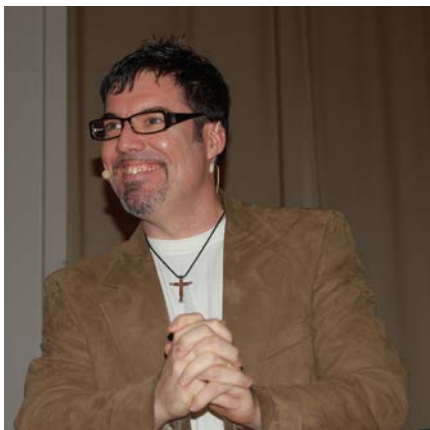
En salvet sanger og forkynter.