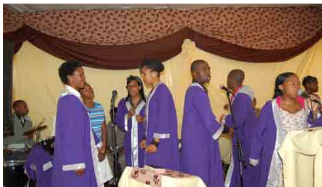
En dansende og syngende menighet.

Sør-Afrika – skal man sammenfatte dette landet i et ord, så må det bli kontrast. Et land med så store forskjeller så tett innpå en annen er ikke rart at det lett kan bli konflikter. Men det viser seg at denne nasjonen på tross av sin spesielle historie greier å takle akkurat den biten noenlunde.