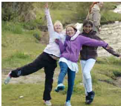
De tre jentene som dørte seg.

Dåpen blir reell når det er på den måten. Man døper seg ikke fordi det er slik kirkesamfunnet pleier å gjøre det, nei – man gjør det fordi man har gitt sitt liv til Jesus og vil lyde Ham og Hans