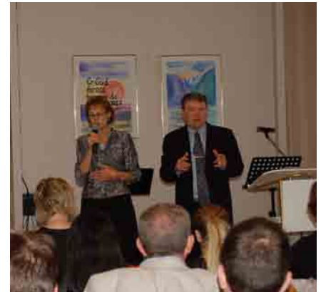
Jackie med grundig undervisning.

Om noen ønsker å høre denne undervisningen, så er det mulig å se videoer fra møtene på Youtube, det er bare å søke opp Ulsteinvik Bibelsenter.