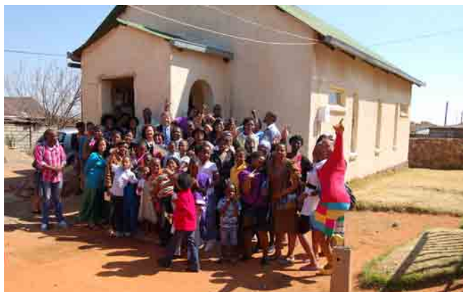
Menigheten i Krügerdorf.