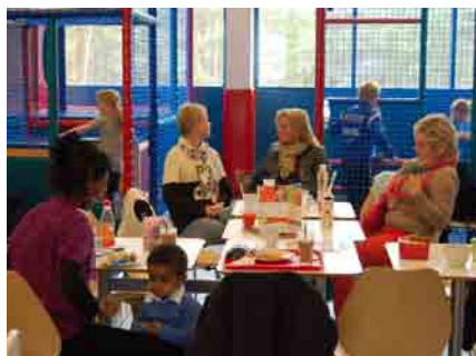
De voksne koste seg med mat og drikke i kaféen..

Mens foreldrene kunne slappe av med kaffe og smørbrød, fikk barna brenne av seg noe energi i klatretårnene med rop og latter. Til og med de minste barna så du til å like dette, der de krabbet over polstrede forhøyninger og strakte seg ut etter neste utfordring. En hyggelig dag for alle sammen.