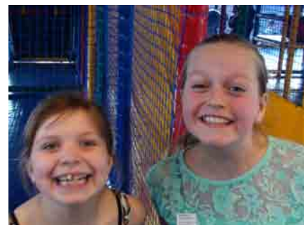
To jenter som var storfornøyd.