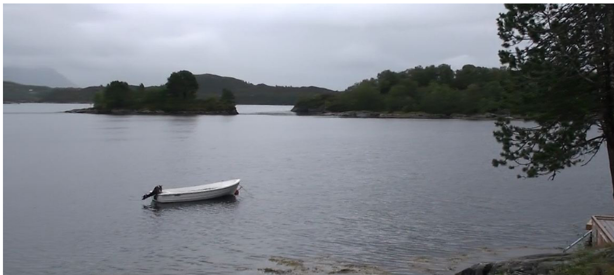
Utsyn fra Budaneset.

For andre gang hadde menigheten weekend samling på Budaneset på Leikong i oktober. Selv om dette ble litt sent på året, så hindret det ikke en gjeng unge å fyre opp det utvendige boblebadet og jumpe uti. Her var det full rulle med overnatting første natten kun for ungdomslederne og ungdomsgjengen.