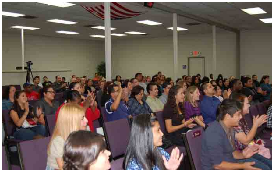
Den meksikanske menigheten Life Christian Church.

når flyet skal gå. Det samme er med livets reise, at man er på plass og i posisjon når Gud kaller og oppgraderer. Om du vil se et kjapt