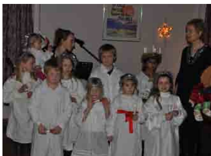
Med tente lys..

Den kristne tro vokste opp ikke på grunn av omstendighetene, men på tross av. Dette er noe vi kan ta med oss i hverdagen at der er noen som har gått foran oss og banet veg for at der faktisk i dag finnes barmhjertighet, frihet, menneskeverd, gjensidig forståelse og velstand i alle fall i deler av verden. Og ser man på historien, så er det ganske innlysende hvilke områder på planeten vår som har disse verdiene, nærmest innebygget i folkesjelen. Det er i de landene hvor man har gitt rom for evangeliet og frelsen ved nåde og tro. Faren i dag er at man er blitt så blasset og overfladisk at man glemmer denne sannheten. Derfor er