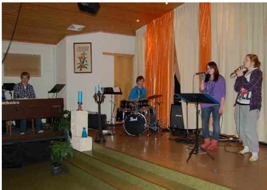
Ungdommene ledet lovsangen.