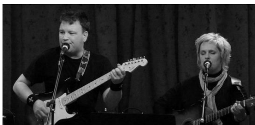
Fra kveldskonserten på New Life.

Man skal ikke forakte konserter som et sted hvor mennesker kan møte Gud og vi vet aldri hva Gud taler til og kommuniserer til den enkelte gjennom musikk. Variasjon i utbredelsen av evangeliet er en berikelse som vi skal vite å verdsette. Forhåpentligvis kan vi gjøre noe lignende en annen gang, kanskje et annet sted, eller på samme sted selvsagt.