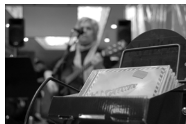
CD på tilbud.