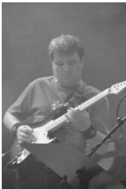
Geir med gitarsolo.

I og med låtene er egenproduserte, så måtte de innrapporteres Tono for registrering. Dette fordrer selvsagt at man har et navn og det viste seg å være vanskeligere enn man først trodde. Første navnet på bandet viste seg å være opptatt av to andre band – et bluegrassband i USA og et heavy metal band i Sveits. Men til slutt endte man opp med RescueZone. Dette navnet har en viss betydning, at man må komme seg inn i redningssonen med livet sitt. Hva det vil si, er at man kommer til et sted der man faktisk lytter til hva Gud har å si til oss mennesker. Først da blir man frelst. Men valget ligger hos hver enkelt av oss mennesker, vi må selv ta valget for Jesus. Så selv om man befinner seg på et sted der Guds Ord blir forkynnt, altså i redningssonen, så må man likevel ta et aktivt valg og begynne å tro på evangeliet – først da blir man frelst. Dette skjer inne i redningssonen – derav navnet RescueZone.