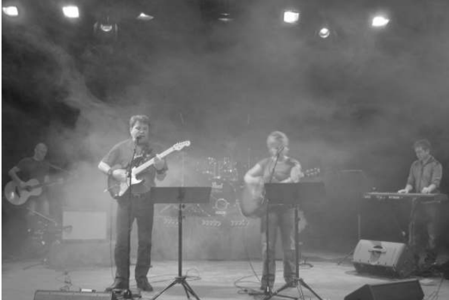
RescueZone i aksjon.

RescueZone er navnet på bandet som har sitt første CD-slipp. Dette skjedde 5.oktober 2008 med fullt trøkk. Bandet som har spilt sammen en stund og jobbet intenst med denne CD-utgivelsen er veldig glad for å nå kunne presentere musikken sin på denne måten. Alt låt materialet er egenprodusert, både tekst og melodi, her er ingen cover låter. Albumet som har fått tittelen Highway innholder musikk i nokså bredt spekter, 4 norske melodier og 6 engelske. Disse strekker seg alt fra lovsang, ballade, pop og rett fram rock'n'roll. I ca. 1 år har fokuset vært å få