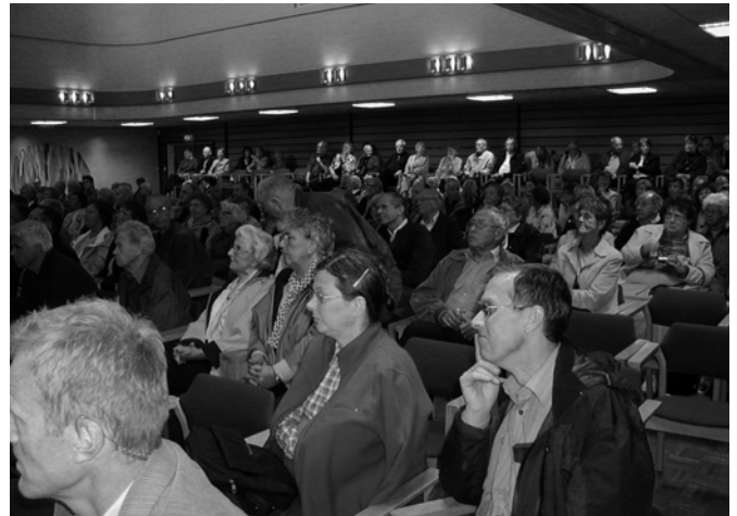
Mange fulgte med