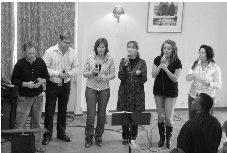
Lovsangsbandet fra Sion stilte opp med fullt trøkk.