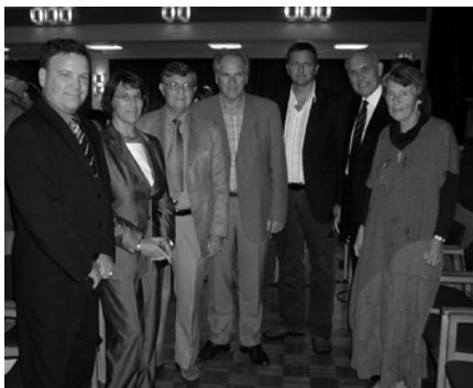
En gjeng med Israelsvenner.