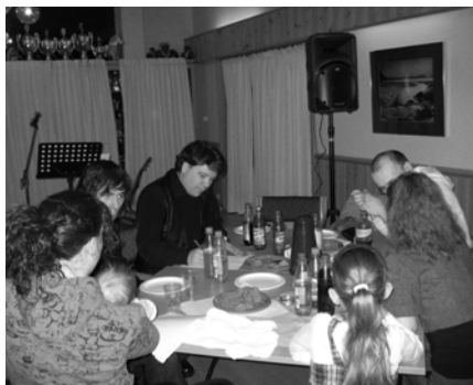
Et konsentrert lag.

Utfordringen for disse to som lager spørsmålene og oppgavene kan ofte være at de sitter med andre bibeloversettelser enn det deltakerne vanligvis leser i og da kan det fort bli misforståelser i spørsmål og svar. Dette påminner oss om at det kan være nyttig å lese i forskjellige oversettelser. Men også denne utfordringen ordnet de på en fin måte og alle som var med i konkurransen hygget seg storlig denne kvelden. Kanskje er ikke dette en normal måte å ha et søndagsmøte på i en menighet,