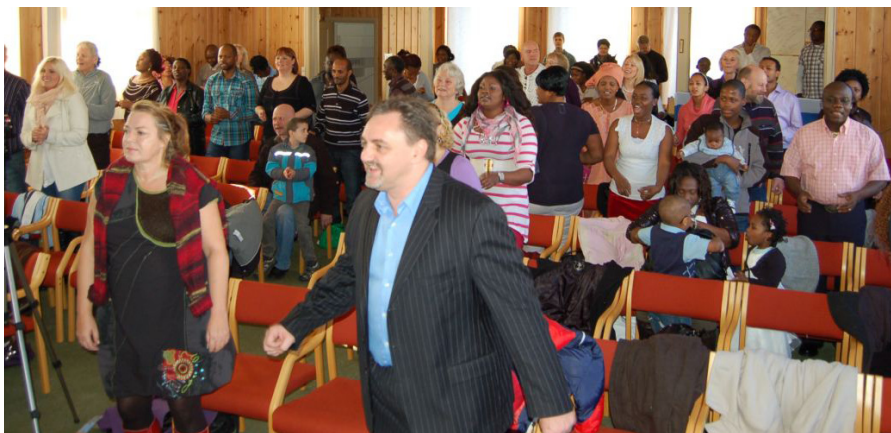
Mange møtte opp.

Så var det igjen tid for Good News International å være på banen igjen. Denne gangen var det til Østlandet ferden gikk, nærmere bestemt til Drøbak og Skien.