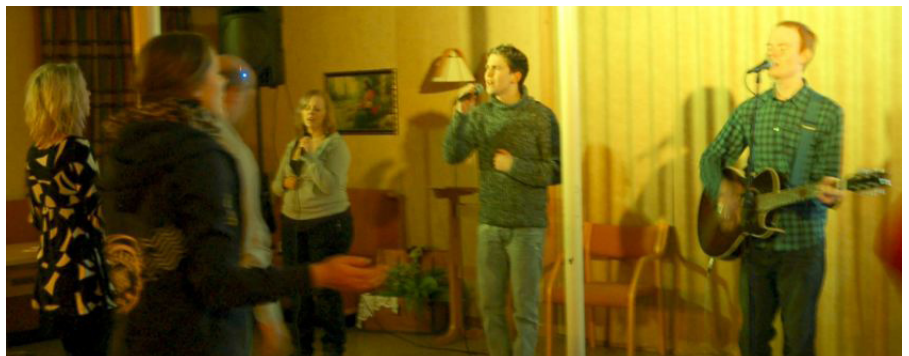
Sterk lovsang preger møtene på The Rock.

Lovsangen var sterk og salvet, selv om man ikke hadde fullt orkester. Men det går bra likevel, bare hjertene er åpne og søkende etter Herrens nærvær. Ordet om frelse fikk i alle fall et godt grunnlag gjennom lovprisningen og fokuset som denne gjengen holdt. Her var det enkelt og fritt å tale, noe som er et godt tegn når