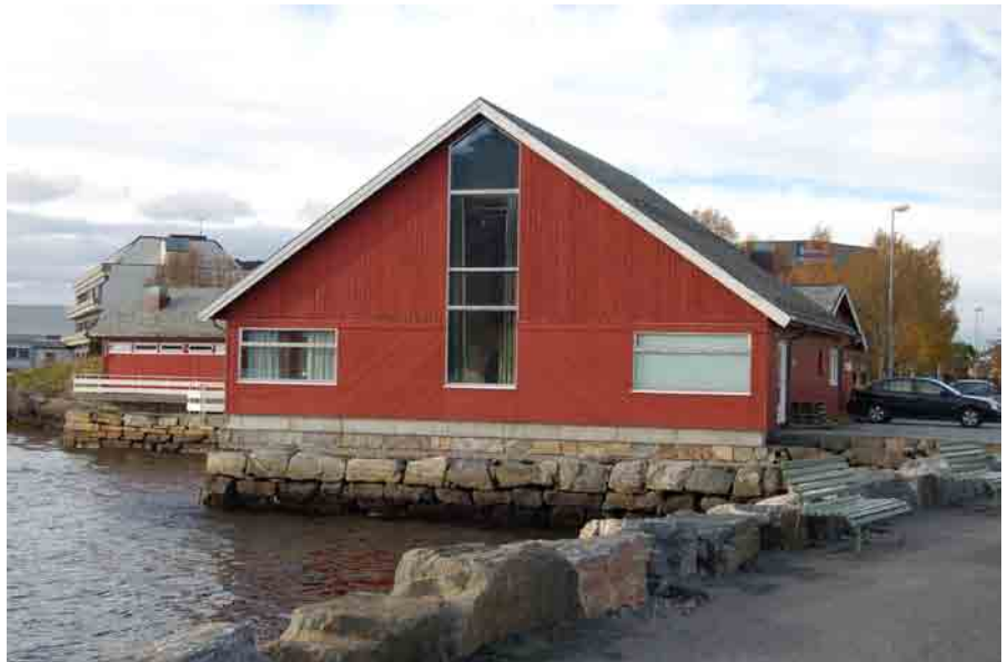
Aktivitetshuset - vårt nye lokale.

Vårt nye lokale er nå Aktivitetshuset som ligger ved Ulsteinvik Småbåthavn. For dette lokalet har vi fått inngå en gunstig leigeavtale som er tilpasset våre behov. På første møtet kjennte vi alle sammen en god stemning og barna syntes dette var helt topp. Nå har de mye, mye større søndagsskole rom å boltre seg på og vi har fått en møtesal som er høy oppunder taket og med gode muligheter til å holde større konferanser i. Lydforholdene er heller ikke noe å si på. Det er langt enklere å stille lyd i et rom som er høyt under taket.