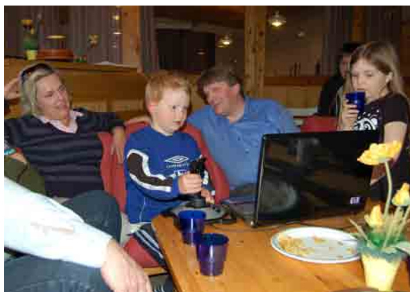
Store og små hygger seg i sofakroken.

Det er noe å tenke på at noen en gang har lagt ned store ressurser, tid og krefter av sitt liv for å få dette til. Der var noen som hadde en visjon. Kanskje er det noen i vår tid som skal ta tak i den visjonen igjen og få stedet opp å gå. Dette vet bare Gud. En trivelig helg var det iallefall.