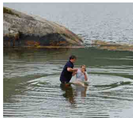
Frisk dåp i sjøen.

Vi ønsker selvsagt at ennå flere skal gå dåpens veg, men dette er et valg kun den enkelte kan gjøre for seg i sitt liv. Ingen kan velge for andre i dette spørsmålet, men er man ærlig mot Guds Ord, blir dette valget ikke så vanskelig likevel. Herren vil være med og velsigne oss når vi velger rett i forhold til det Han har sagt.