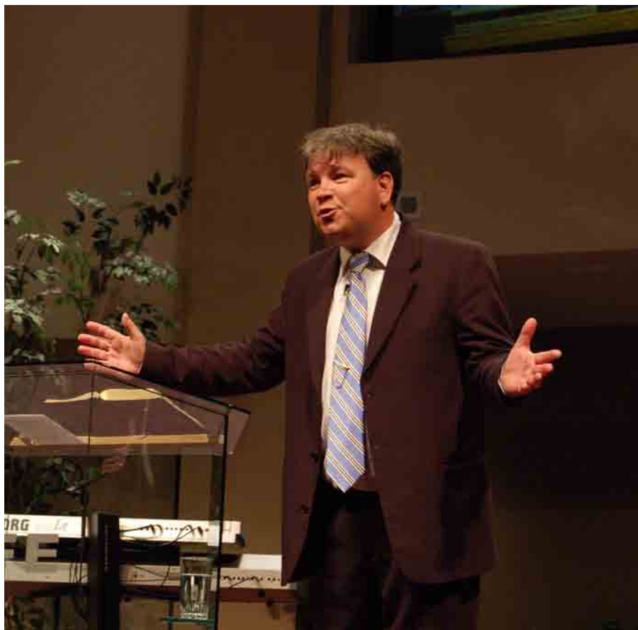
Menigheten i San Diego ville gjerne høre norsk.

Men det herligste ved dette besøket var at flere mennesker ble frelst når vi talte i menigheten. Noen frafallne kom tilbake og noen tok i mot Jesus for første gang. Dette er alltid like herlig når slikt skjer. Og at denne menigheten har ufrelste på sine møter er ikke så rart, når vi